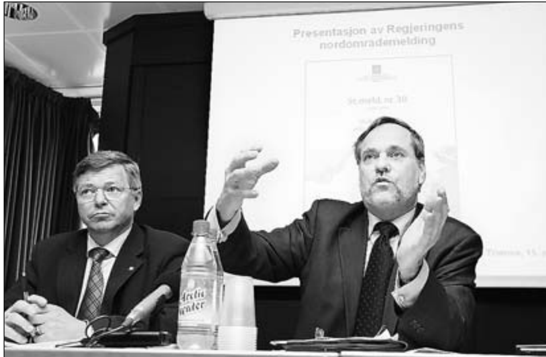
NORDOMRÅDENE Statsminister Kjell Magne Bondevik og utenriksminister Jan Petersen presenterte regjeringens nordområdemelding i Tromsø for tre uker siden.