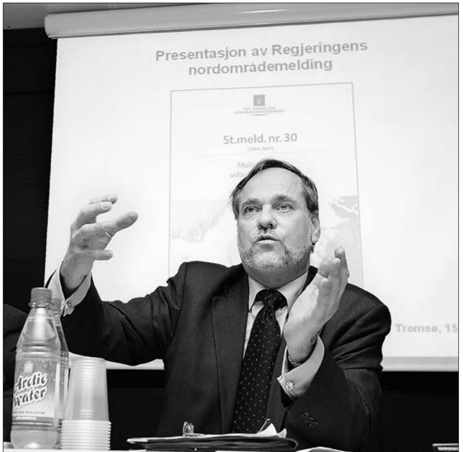
NORDOMRÅDENE Regjeringens nordområdemelding «Muligheter og utfordringer i nord» ble lagt fram av utenriksminister Jan Petersen i Tromsø i april. Kronikkforfatteren mener det må vurderes å opprette en egen norsk polarkommisjon.

Den kanskje viktigste svakheten er at viktige samfunnsgrupper med legitime interesser i nord har begrensede muligheter til å fremme sine synspunkter og liten anledning til å delta i utformingen av politikken. Diskusjon om spørsmål som angår nordområdene blir i stor grad et indre anliggende i departementene. Delvis motstridende mandater, faglig